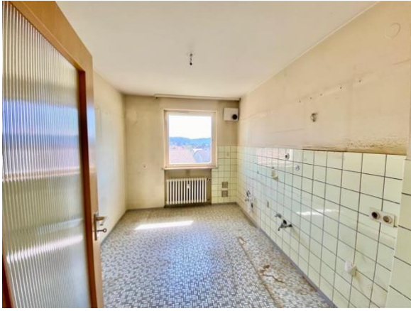
Küche mit Fenster