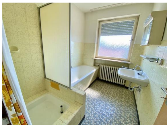
Bad, Dusche, Wanne, Fenster