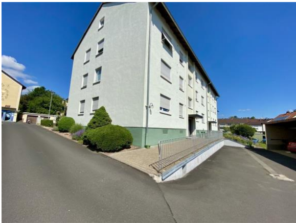
Zufahrt zu Carport, Hauszugang