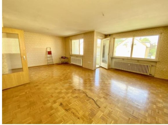
Wohnzimmer mit Parkett