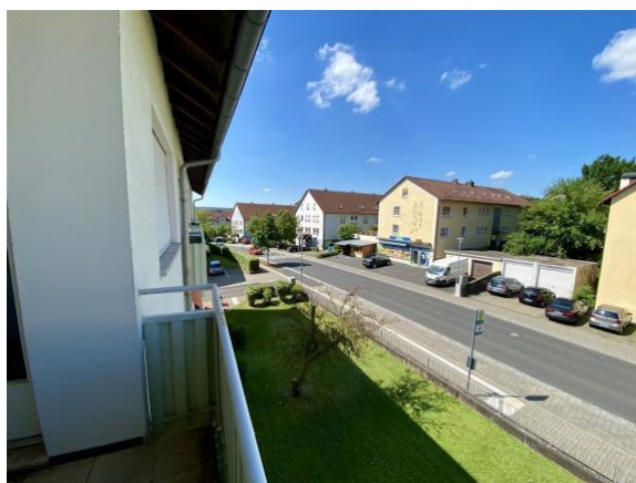
Blick vom Balkon...