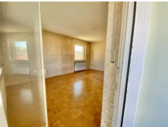
Blick vom Balkon ins Wohnzimmer

Renovieren und erneuern Sie und geben Sie der Immobilie Ihre Handschrift, sodass Sie sich in Ihrem neuen Domizil wohl und zuhause fühlen werden.