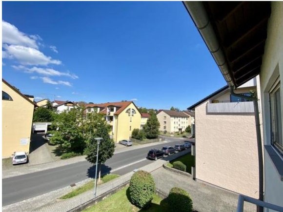
... nach rechts