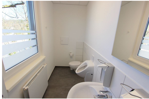
Kunden WC "H"