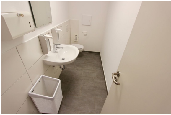
Kunden WC "D"