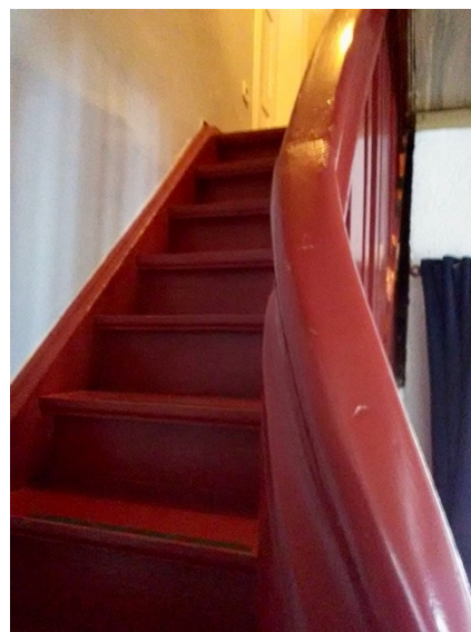
Treppe zum DG