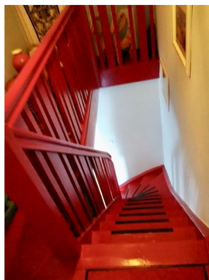
Treppe zum EG