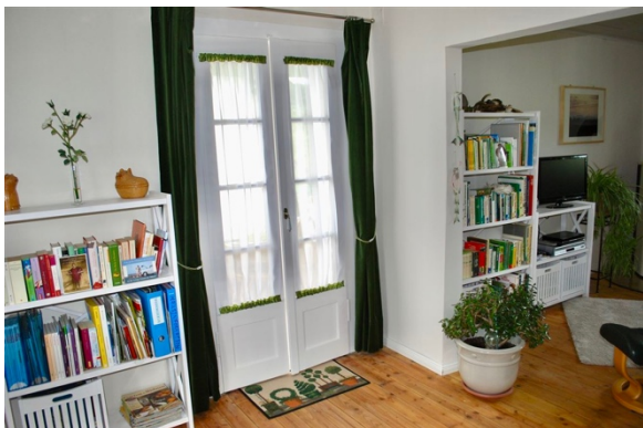
EG Zugang Wintergarten